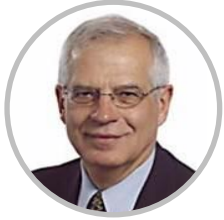
Josep Borrell Ex Presidente Parlamento Europeo; España