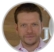
Pedro Less Andrade Director Public Policy and Government Affairs Latin America; Google.

Ponencia de Cierre: Desafíos Regionales en Infraestructura Digital