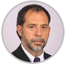
Guido Girardi Senador de la República; Chile.